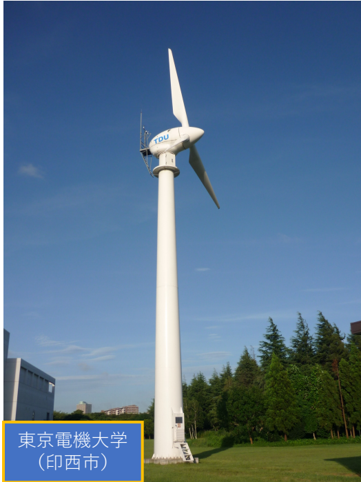
洋上風力発電システムの構想 (東京電機大学、東京)